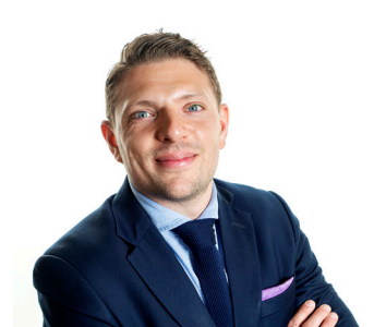
Vice VD sedan 2020