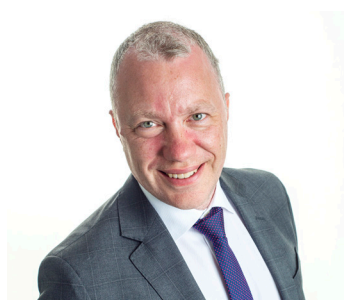
VD & Styrelseledamot sedan 2014

Koncernledningen i Spotlight Group har under 2022 bestått av: