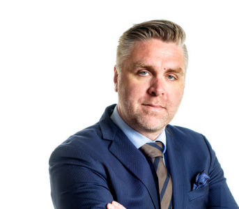
CFO sedan 2014